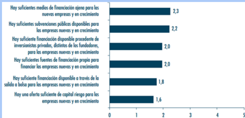
Ilustración 2 Evaluación de las fuentes de financiación para el emprendimiento en Colombia, 2011 Fuente: Reporte GEM Colombia 2011 -2012

Algunas estrategias para cambiar este escenario es la difusión de soluciones de financiación y apoyo no económico (asesores en estrategia, administración y creación de empresas) por parte de instituciones privadas y estatales, ampliando la posibilidad de apoyo al emprendedor diferente al círculo normal conformado por familia y amigos cercanos quienes eran los principales gestores de los emprendimientos.